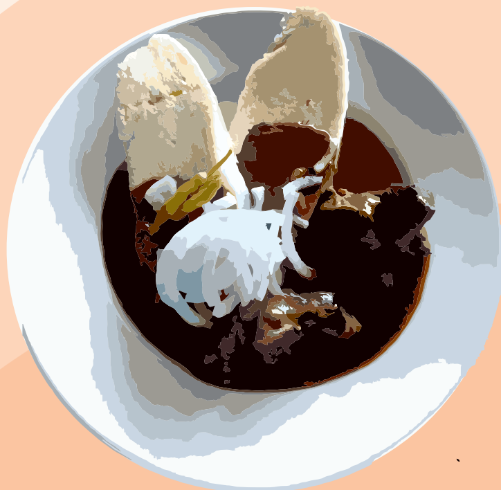
Cerdo Asado con Ajo y Cebolla, Col Blanca y Pan de Patata