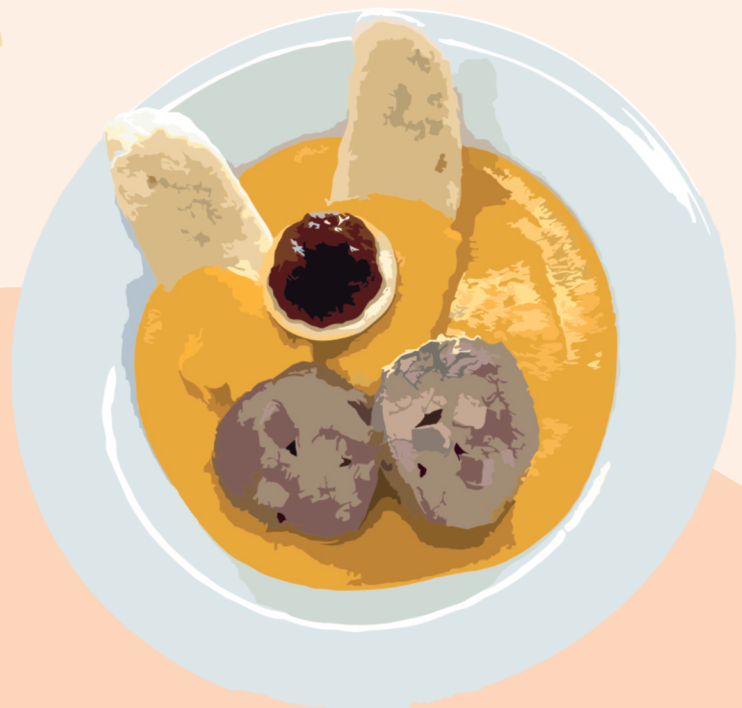
Goulash de Ternera con Pan Cocido al Vapor